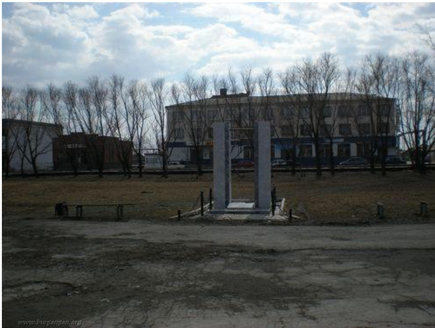
Мемориал Воину – Победителю