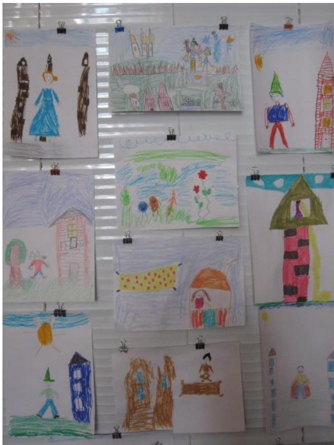
Рисование : «Моя любимая книжка»