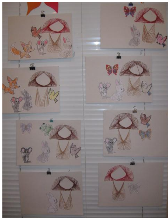
Ручной труд «Под грибком»