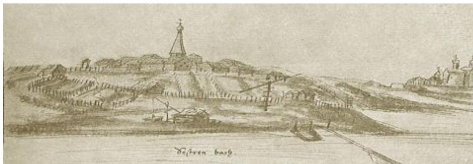
Альбомъ Мейерберга Виды и бытовья картины Россіи XVII века

Долгое время историки спорили о дате основания города. В Троицкой летописи тоже упоминается Кли́н, но Кли́н, находящийся в Троицком уезде Псковской губернии. Кстати говоря, в России населенных пунктов с названием "Кли́н" много. Как в поговорке – «куда ни кинь - всюду Кли́н»