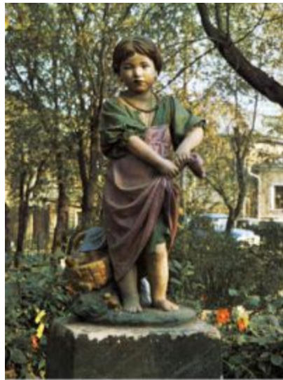
Девочка-грибница в советское время