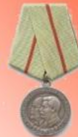
Медаль «Партизану Отечественно й Войны 1 степени»