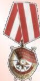
Орден Боевого Красного знамени