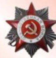
Орден Отечественной Войны 2 степени