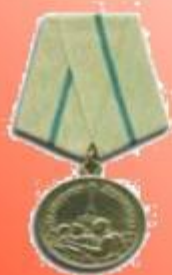
Медаль «За оборону Ленинграда»