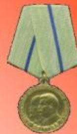
Медаль «Партизану Отечественно й Войны 2 степени»