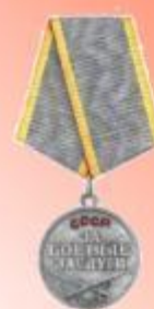
Медаль «За боевые заслуги»