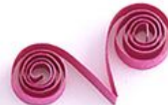
завиток в форме V