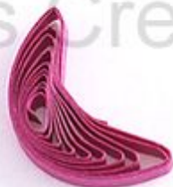
изогнутый полукруг (месяц, полумесяц)