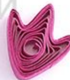
утиная лапка (птичья лапка)