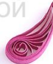
изогнутая капля (крыло, лепесток)