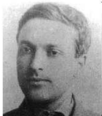
Л. С. Выготский (1832—1920 гг.)

определял возраст как относительно замкнутый период развития, имеющий собственное содержание и динамику. С его точки зрения, хронологический возраст и психологический возраст — два разных, несовпадающих понятия.