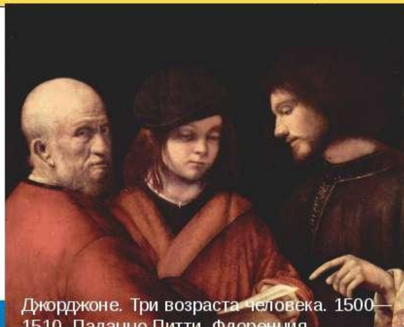
Джорджоне. Три возраста человека. 1500—1510. Палаццо Питти. Флоренция

Возраст — продолжительность периода от момента рождения живого организма до настоящего или любого другого определённого момента времени