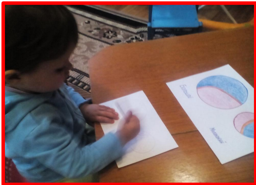
Раскрашивание любимой игрушки