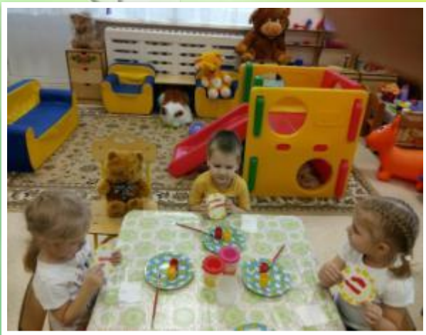
Рисование «Узоры на тарелочке»

Есть на свете много профессий, И важны они всем нам очень: