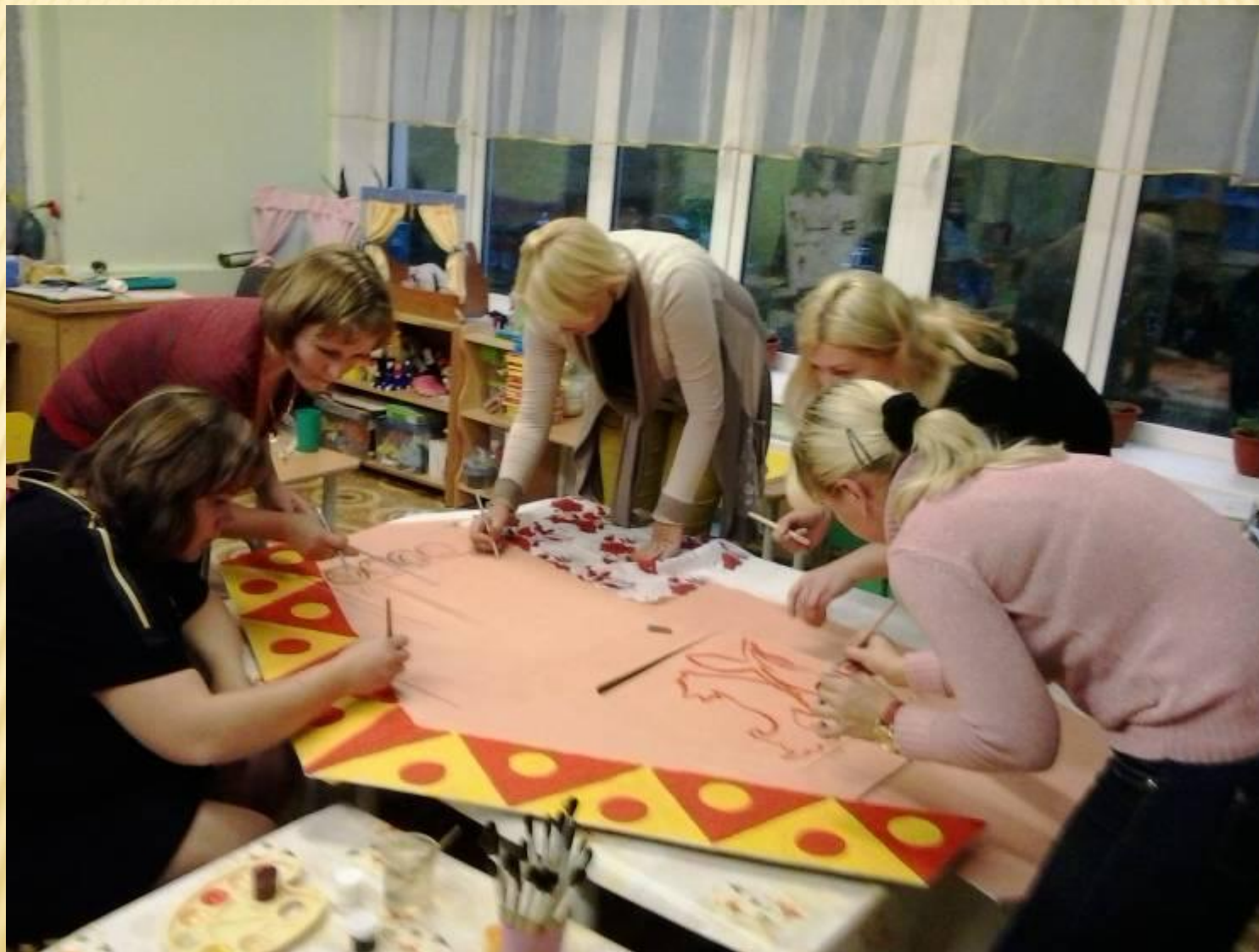
«Изготовление русской народной избы»