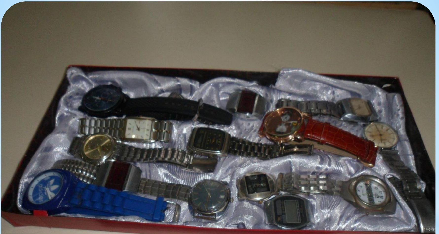
Часы «Мужские ручные»