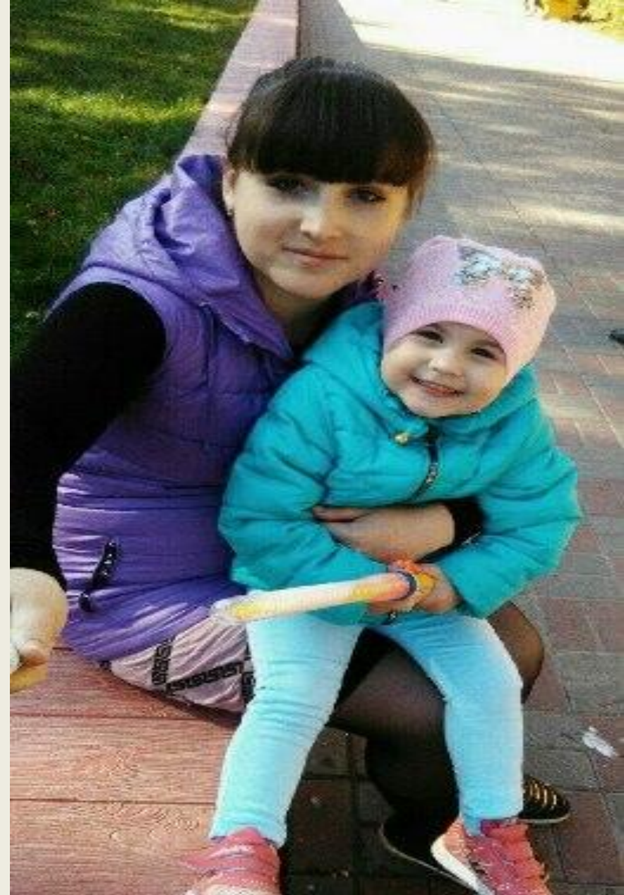
Прогулка по родному городу