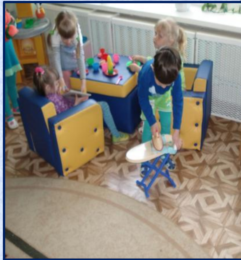
Папа помогает маме погладить белье