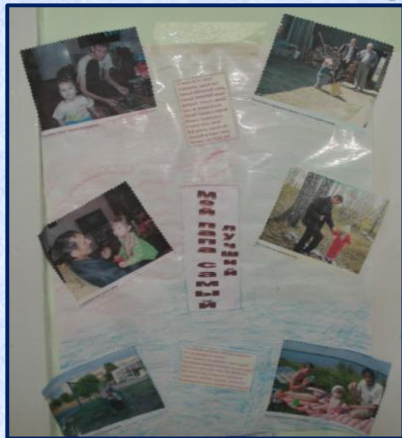
Папа Лизы Аверкиевой