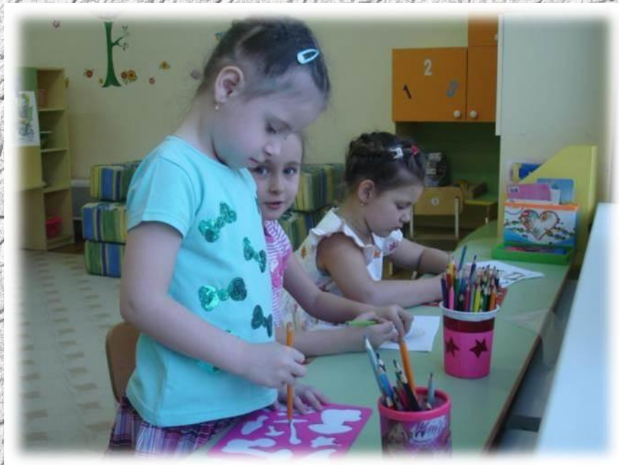
Рисование по трафаретам «Ирисы»