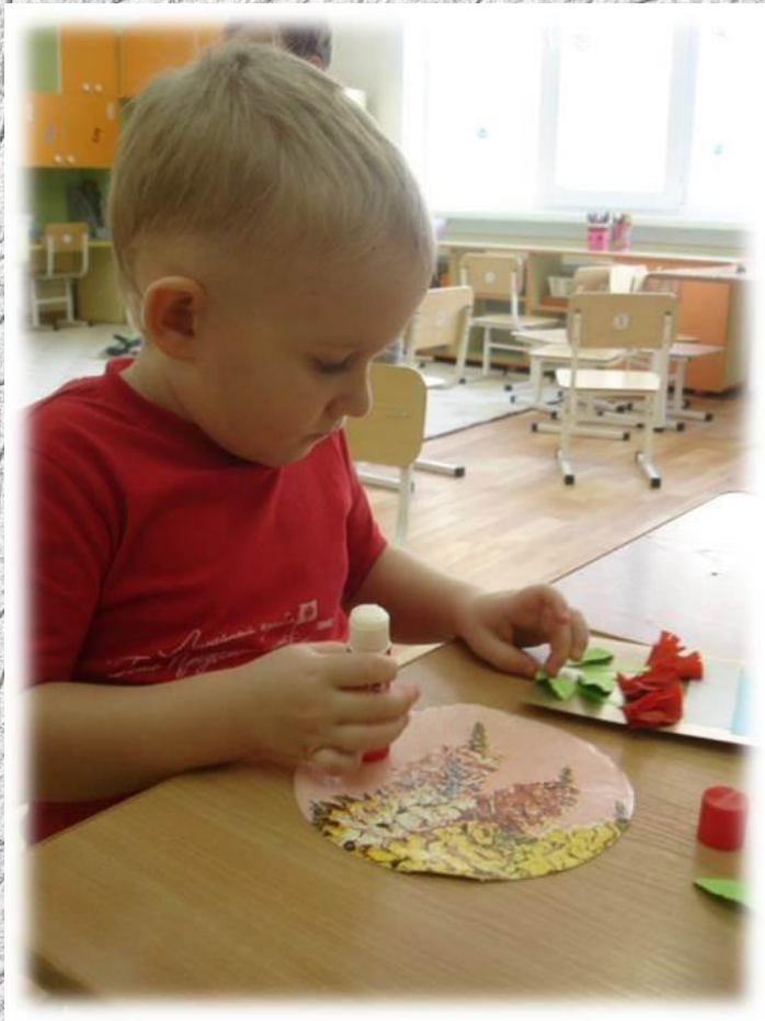
Аппликация «Открытка для папы»