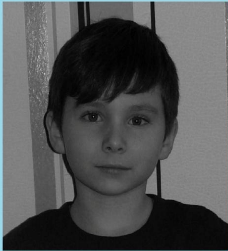
Это - я