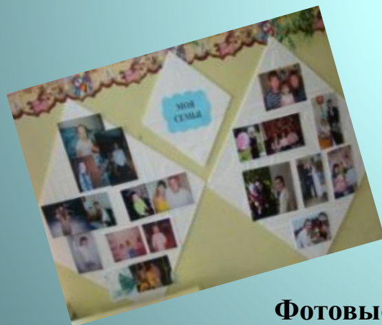
Фотовыставка «Моя семья»