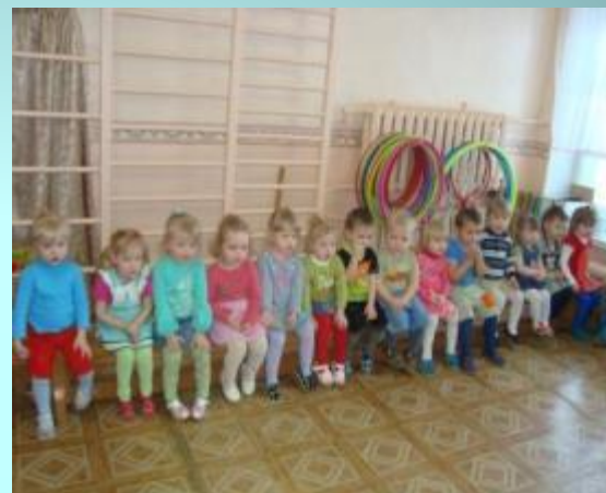
Музыкальное развлечение «В гостях у бабушки Арины»