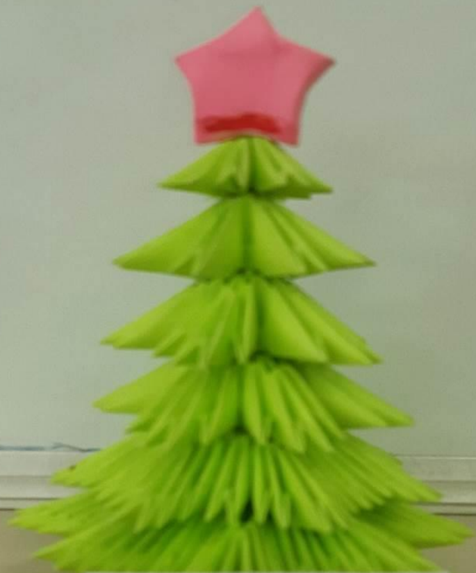
Зинченко Мария Группа №4 «Золотые рыбки»