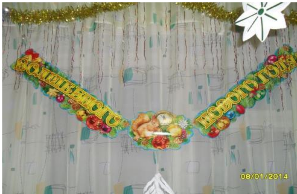
Украшаем ёлочку в группе