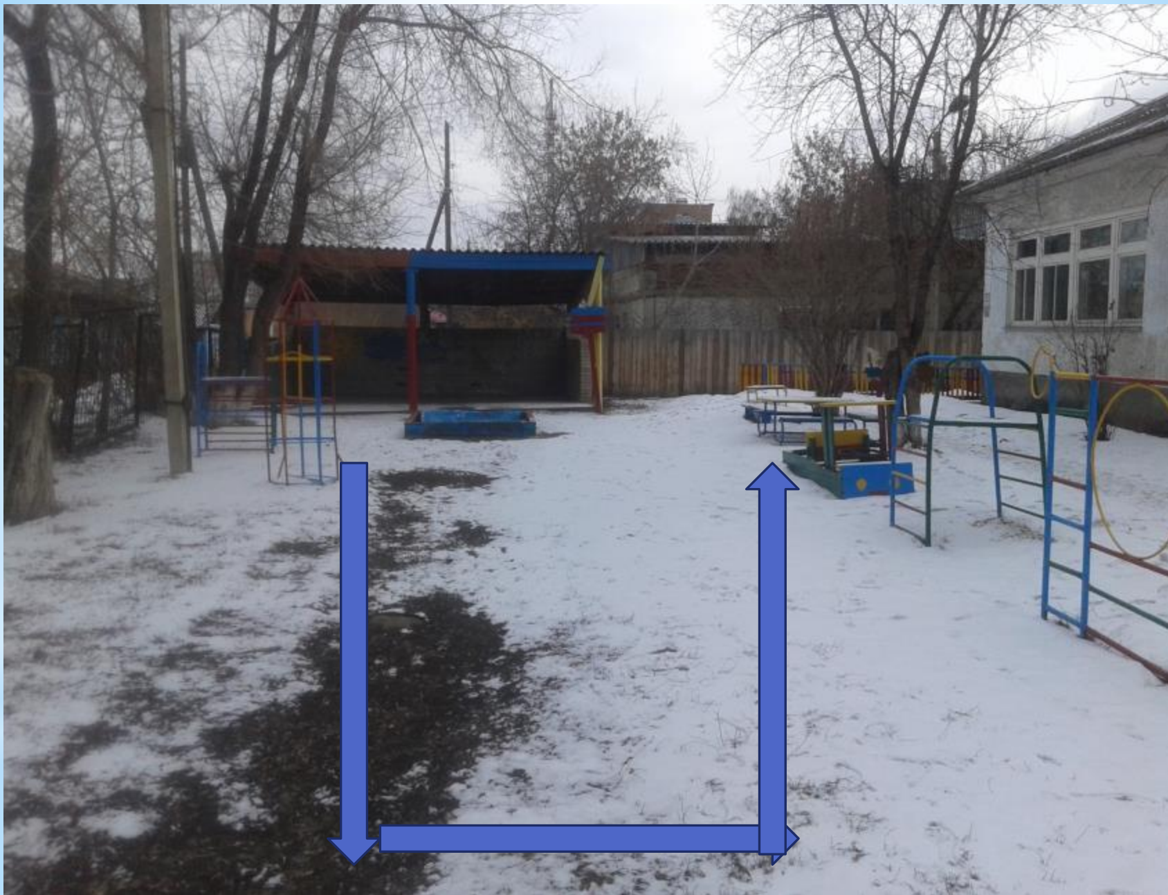
Свободная зона для подвижных игр