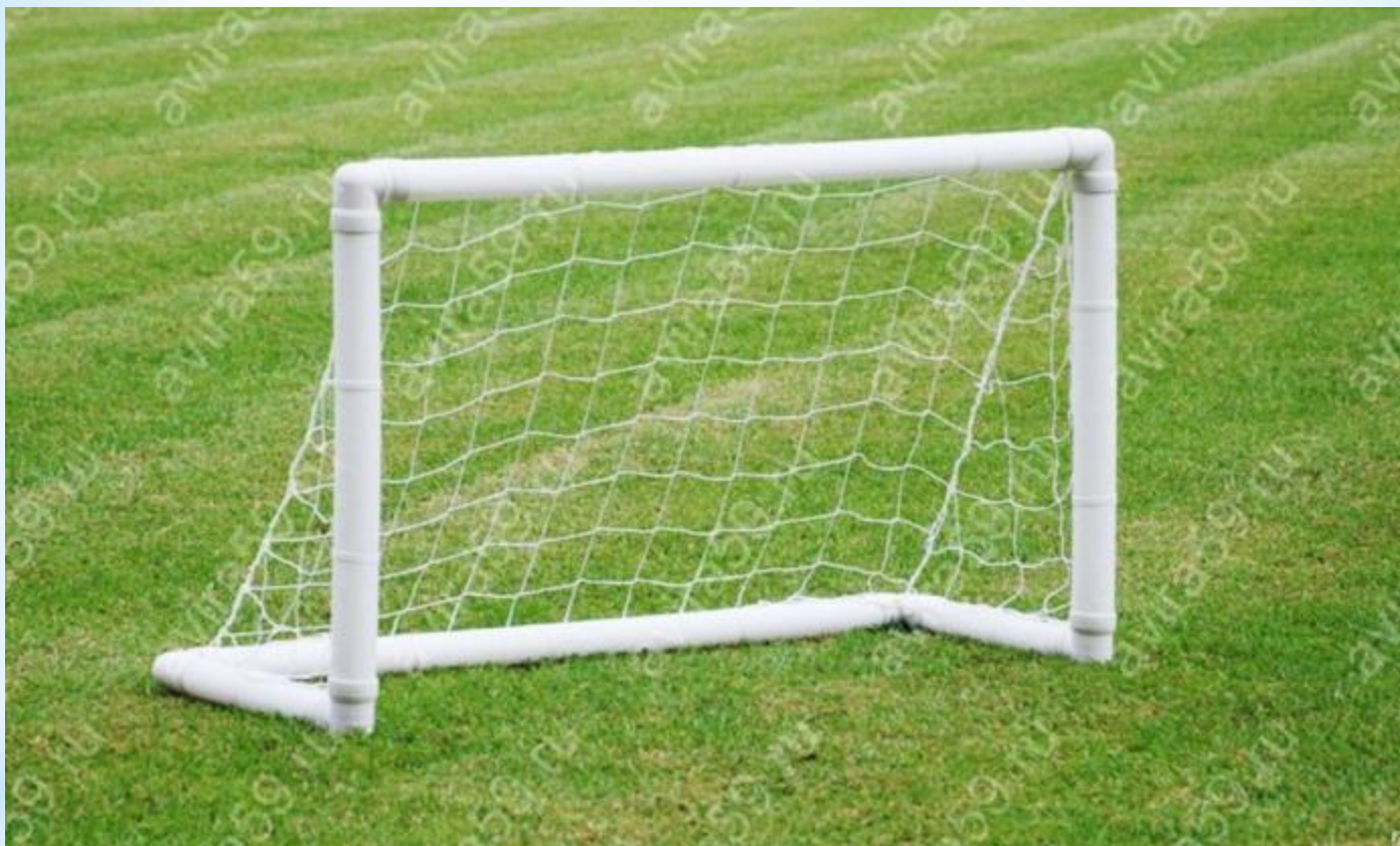
Футбольные ворота: в зону для подвижных игр