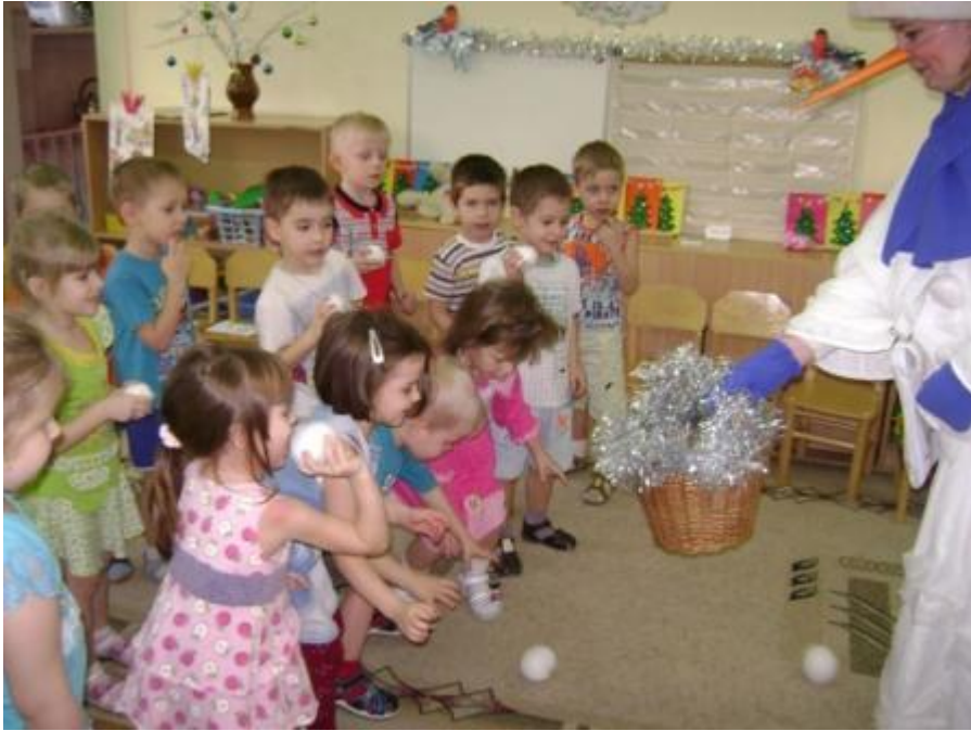
Веселые игры и конкурсы