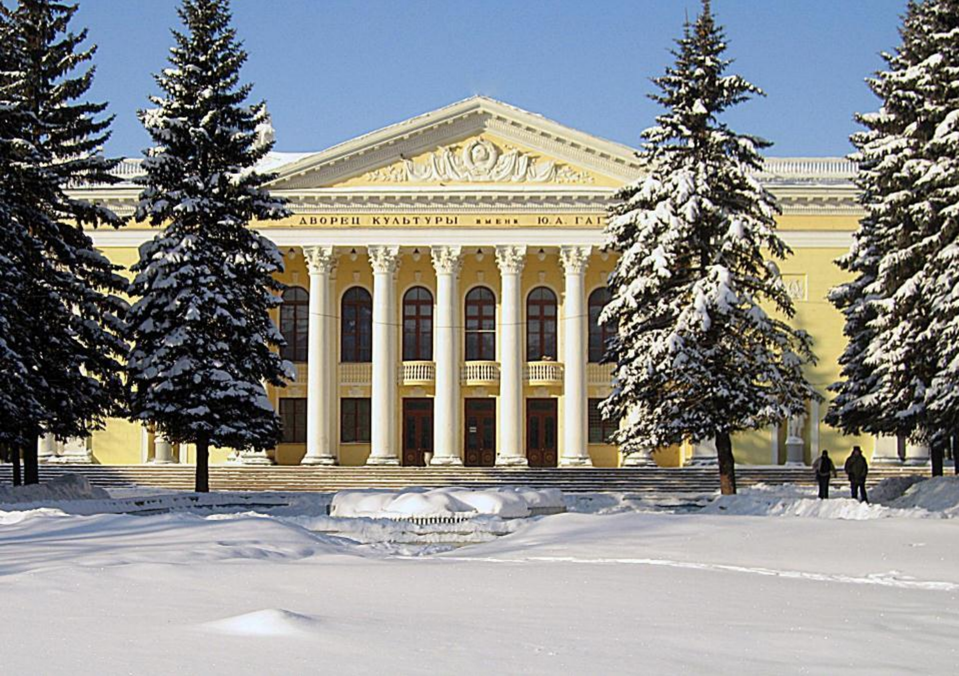
* Дворец культуры им. Ю.А. Гагарина.