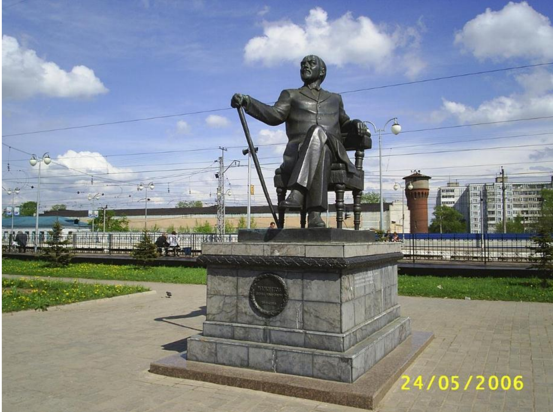
* Памятник меценату Савве Мамонтов (строительство железной дороги через Сергиев Посад до Архангельска).