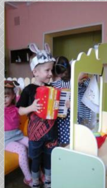
«Т Е Р Е М О К»