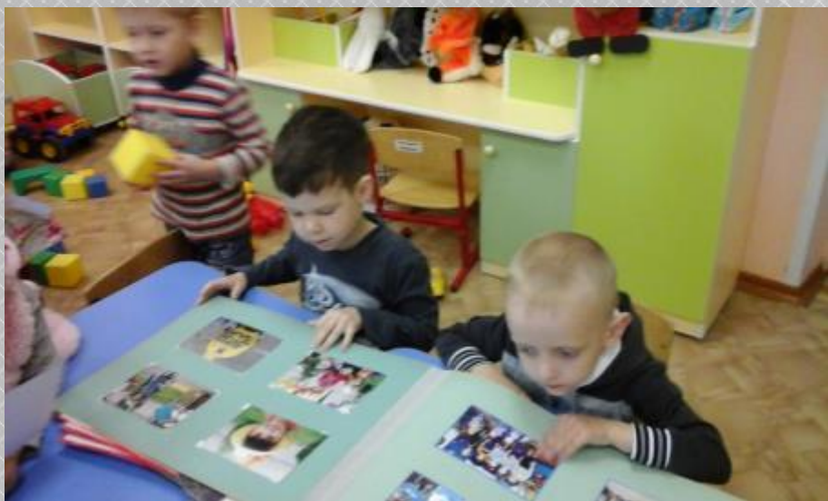
Рассматривание альбома «Дети в садике живут»