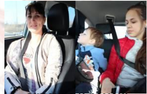
сиденье и ремень безопасности