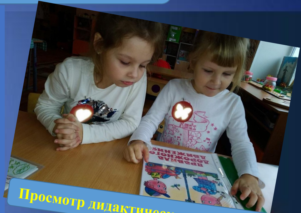
Просмотр дидактического материала