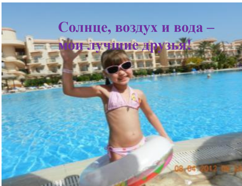
Солнце, воздух и вода – мои лучшие друзья!