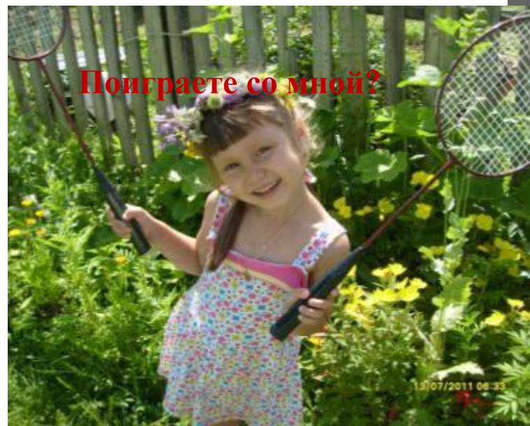
Поиграете со мной?