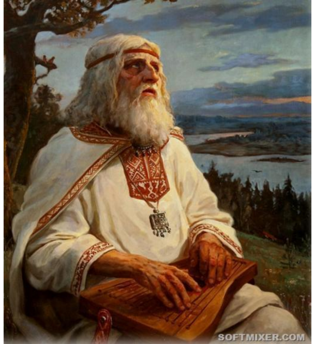
Боян - песнотворец и сказитель