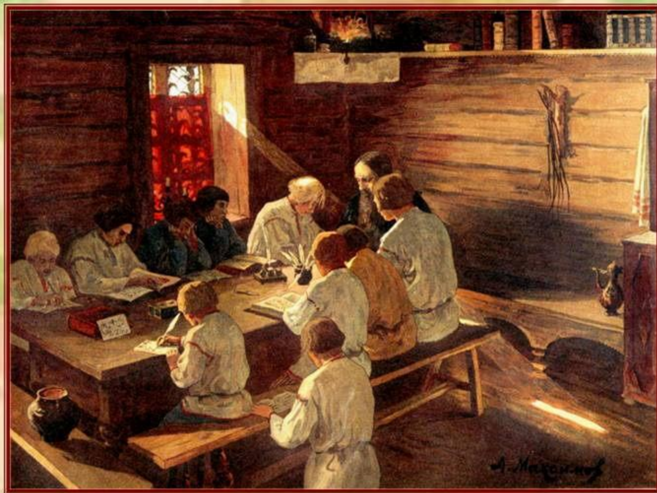
А.Максимов. "Книжное научение".

Истоки русской школы - в Древней Руси. Князь Владимир велел "собирать у лучших людей детей и отдавать их в обучение книжное".