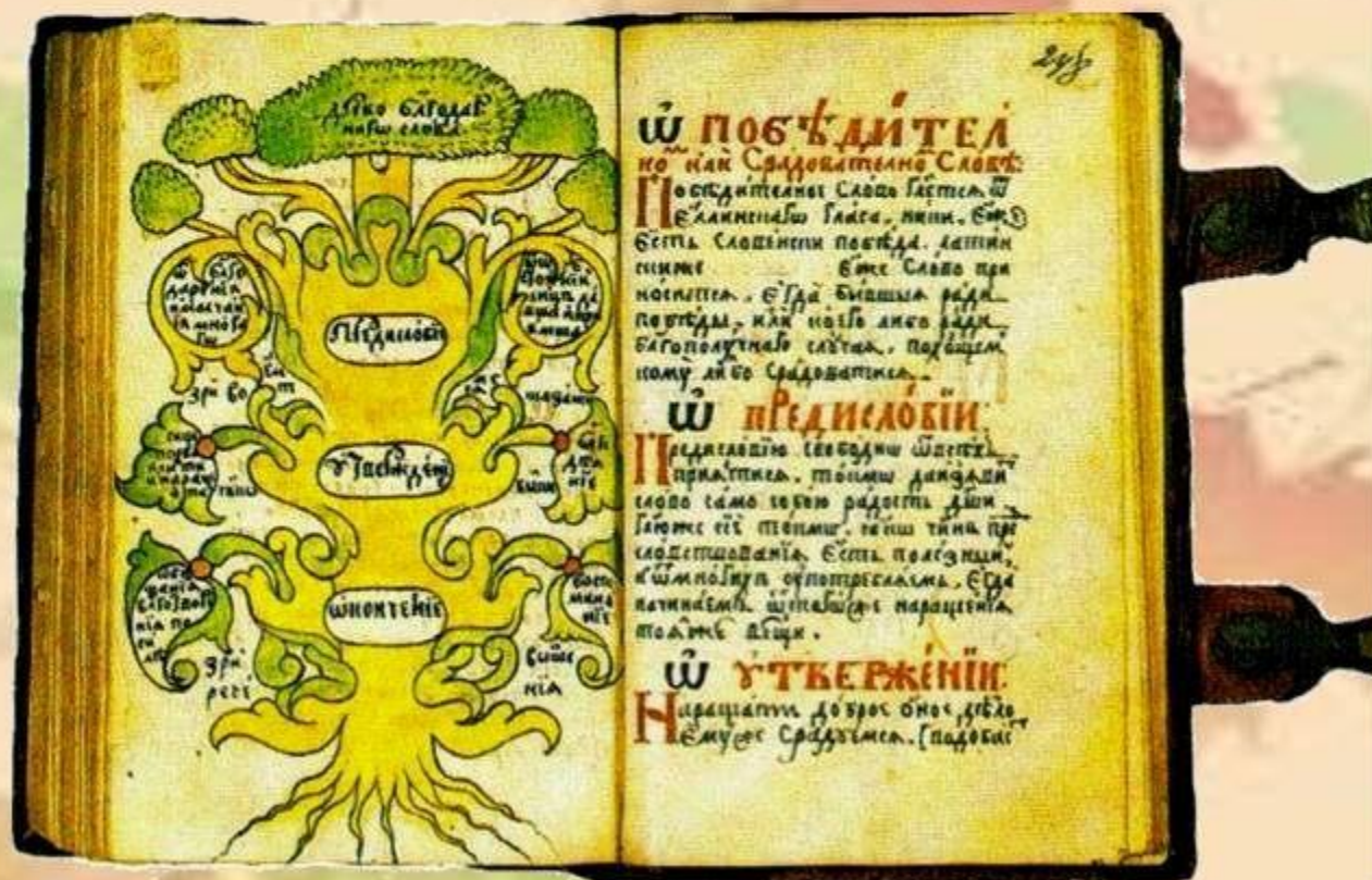
Рисунок из "Философии и риторики" Софрония Лихуды, конец XVII в.

В Древней Греции появились многие педагогические термины: "риторика", "педагогика", а слово "педагог" означало "детоведение, детовожделение".