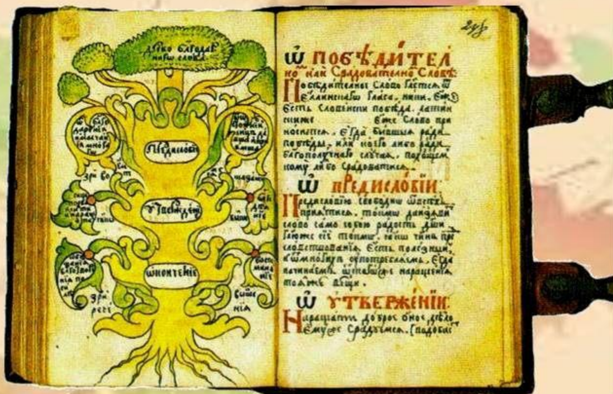
Рисунок из "Философии и риторики" Софрония Лихуды, конец XVII в.

В Древней Греции появились многие педагогические термины: "риторика", "педагогика", а слово "педагог" означало "детоведение, детовожделение".