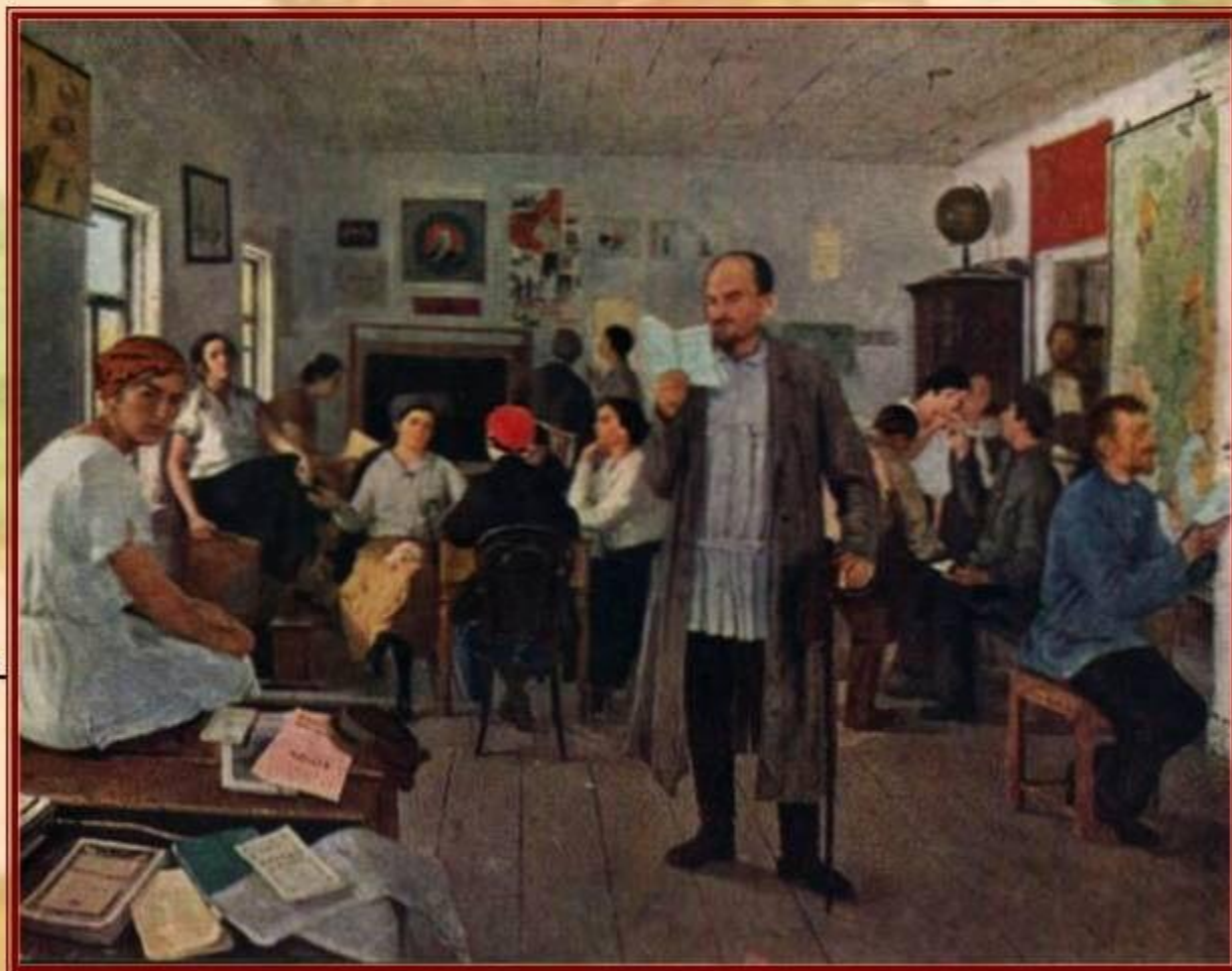
Е. Чепцов. "Школьные работники. Переподготовка учителей".

В начале XX века в России уже 280 тысяч учителей, 289 учительских семинарий, 48 педагогических институтов.