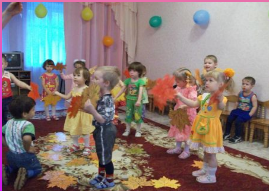
Праздники и развлечения