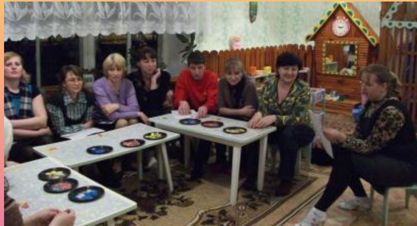
Сотрудничество с родителями