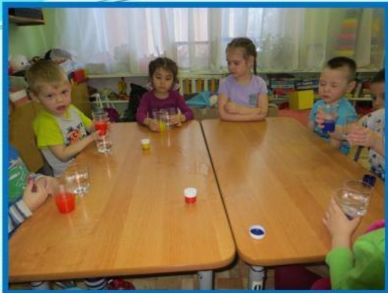
Вода бывает прозрачной и цветной