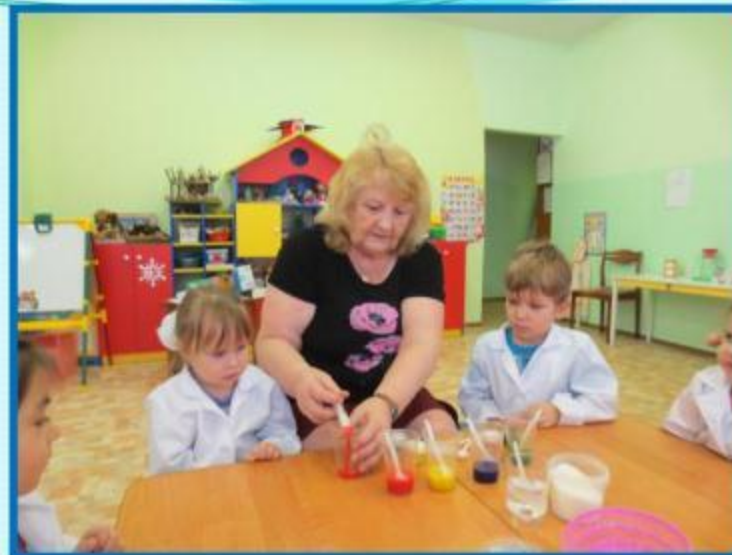
Как интересно получить цветную водичку