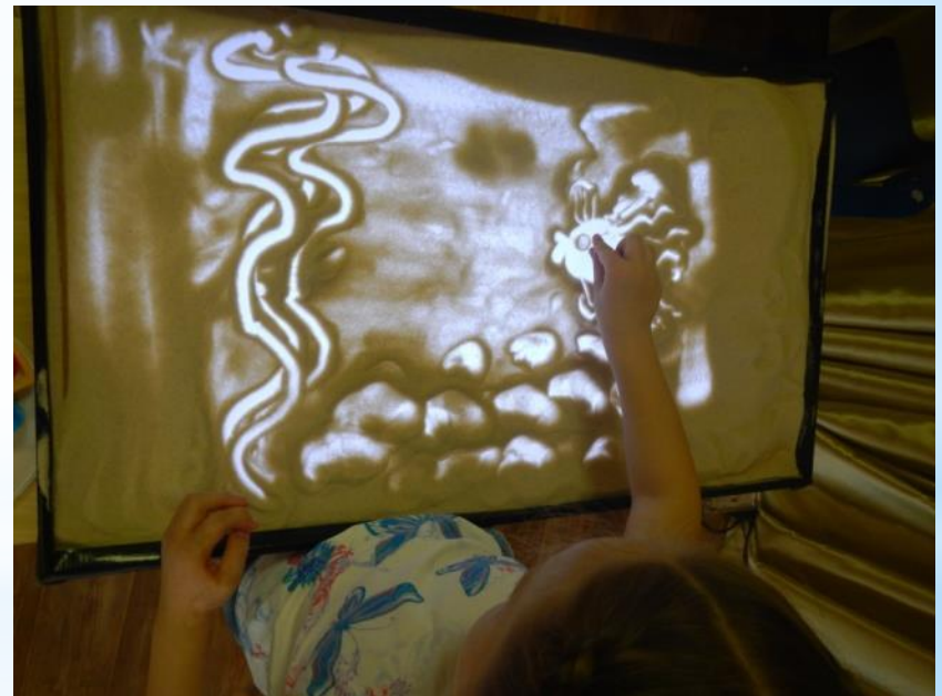
До самостоятельного сюжетного рисования