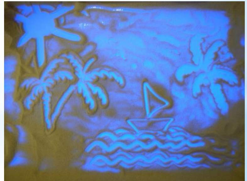
«Путешествие в жаркие страны» (6 лет)