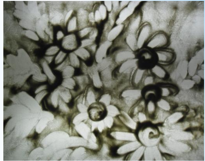
«Букет» Пушкарёва Лера(6 лет)