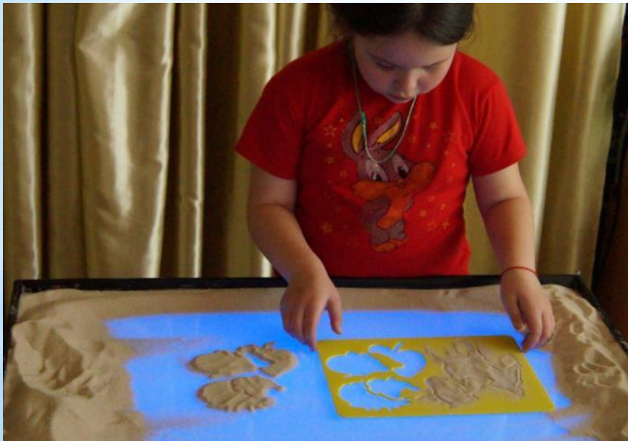
От подготовки руки , освоения основных приёмов рисования песком