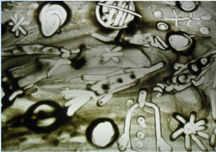
«Космический полёт» Прытков Артём (5 лет)