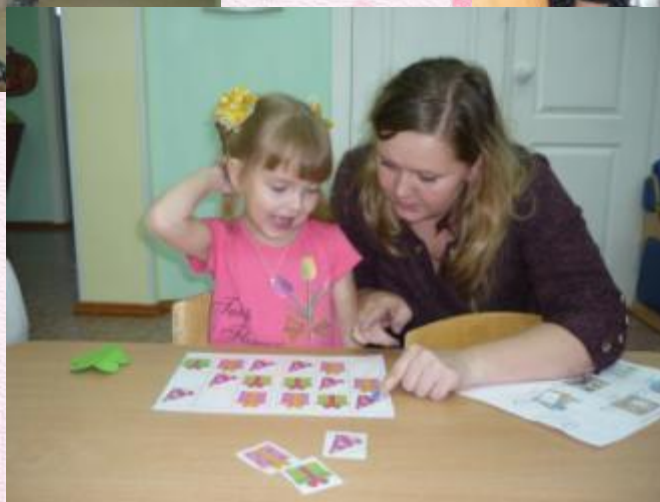
Станция « Логическая»