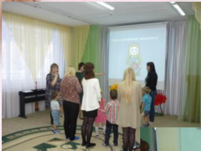
Станция « Музыкальная»