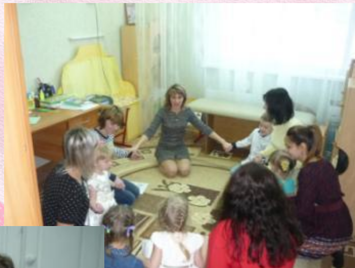
Станция « Занимательная»