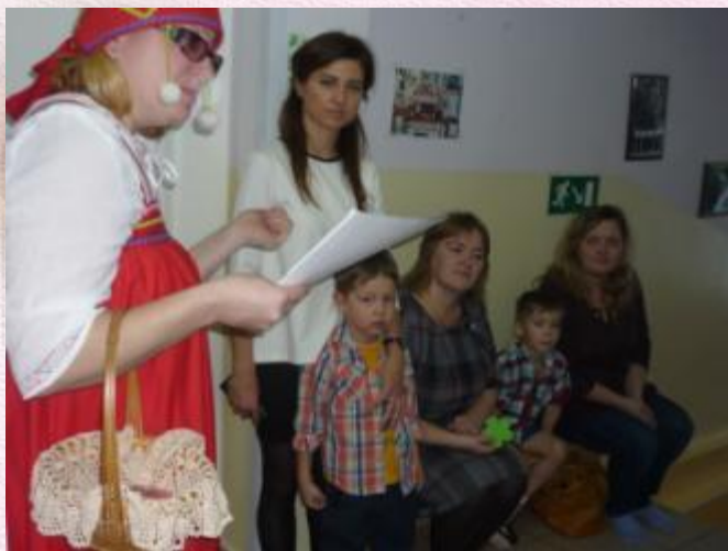
Станция «Отгадай - ка»