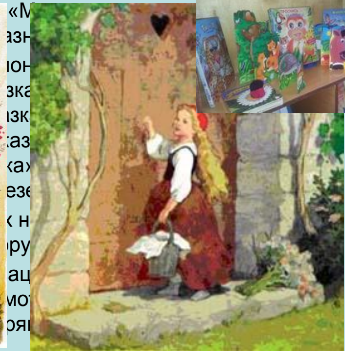
«М зн юн зка изк газ ка езе к н ру ац мо оя