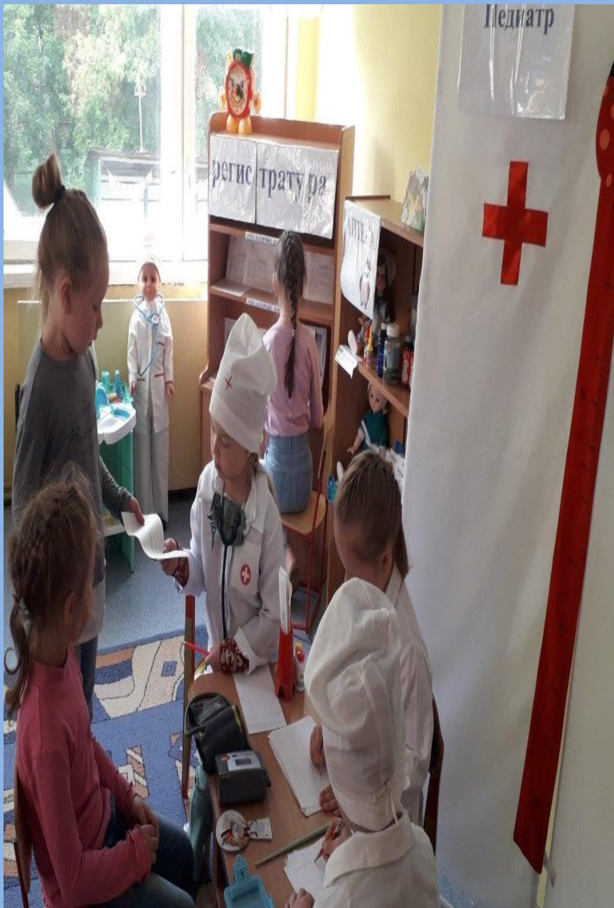
С/р игра «Детская поликлиника»