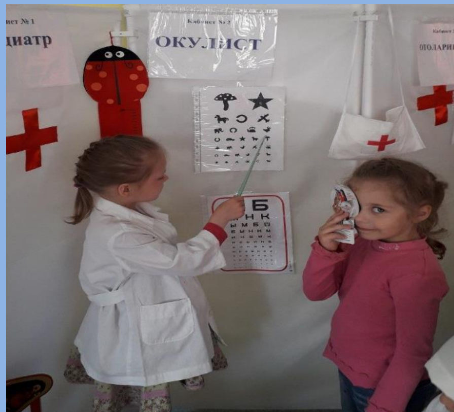
Игровая ситуация «На приеме у окулиста»