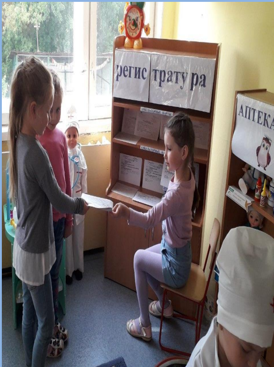
Игровая ситуация «В регистратуре»