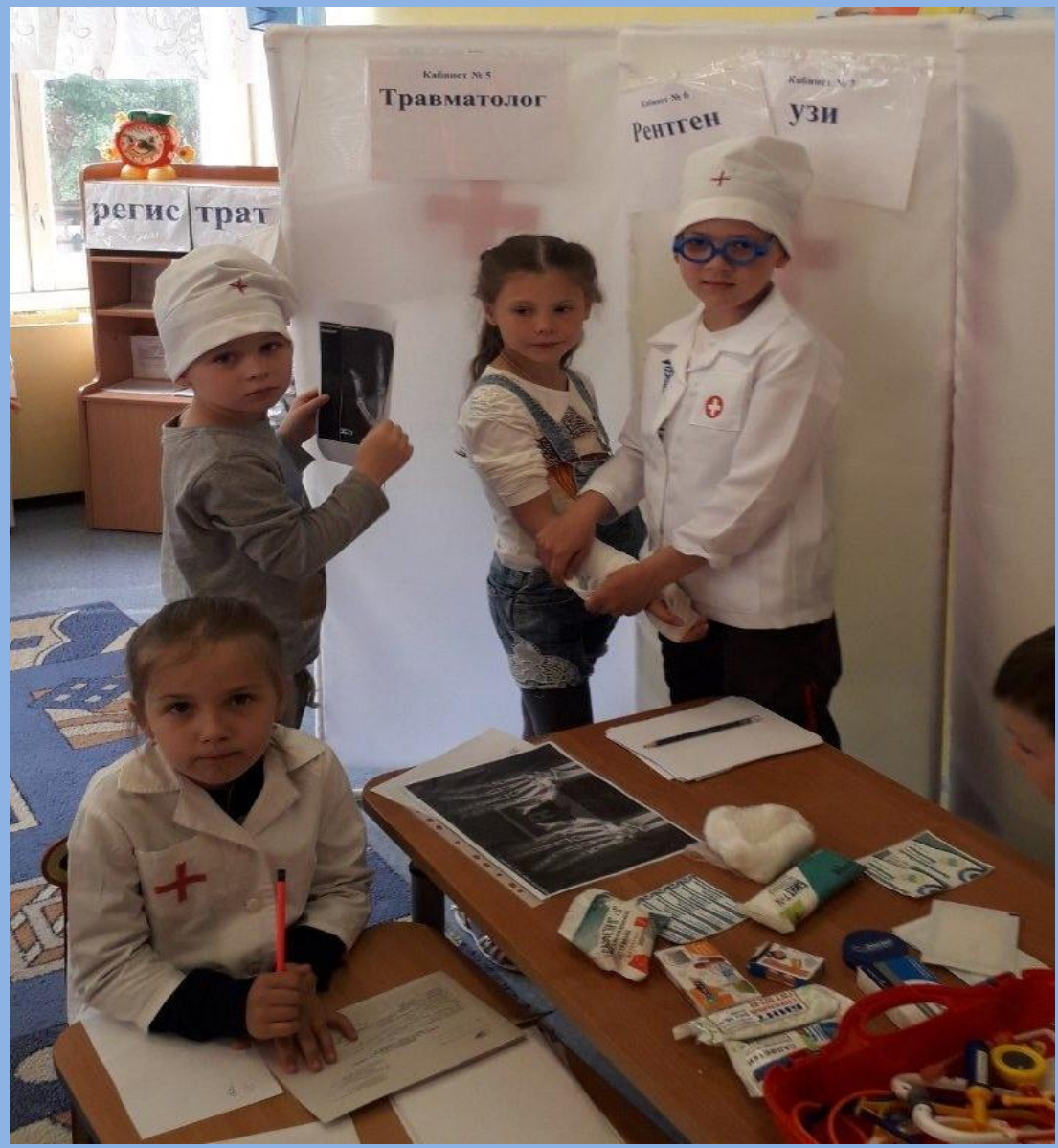
С/р игра «У травматолога»