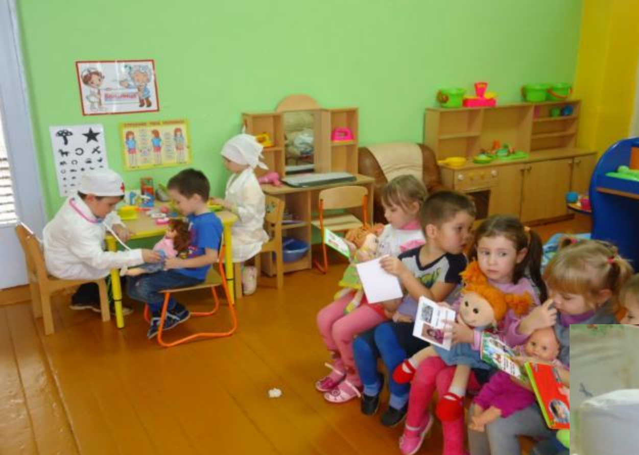
С/р игра «Ветеринарная больница»