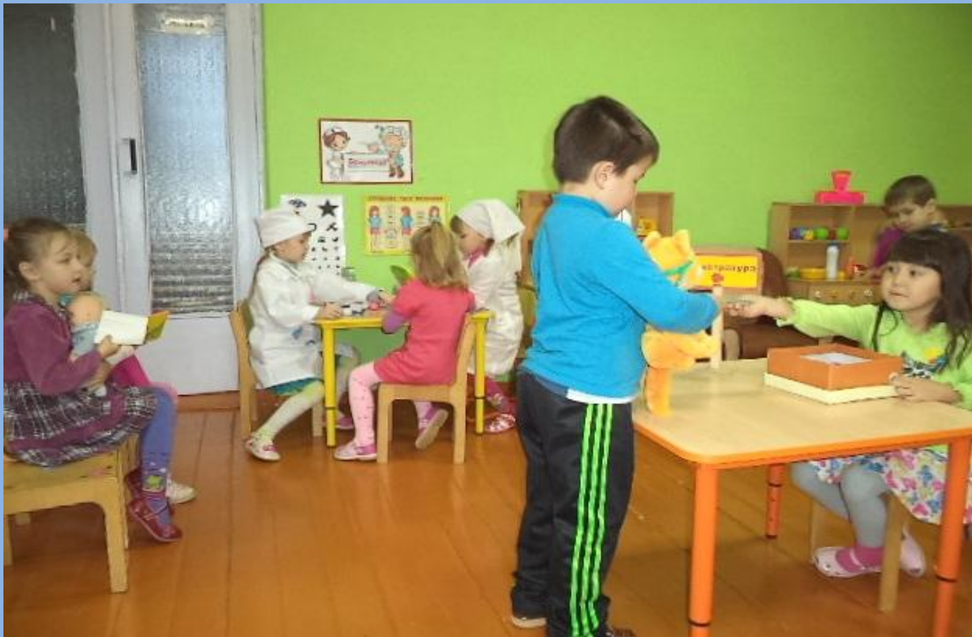
Сюжетно-ролевая игра «Больница»