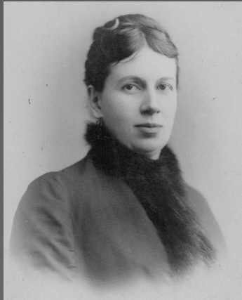
Софья Андреевна Толстая