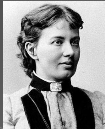
Софья Васильевна Ковалевская