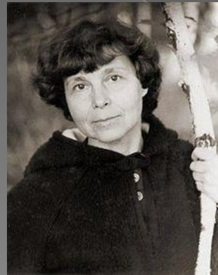
Софья Асгатовна Губайдулина