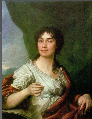
Софья Федоровна Ростопчина