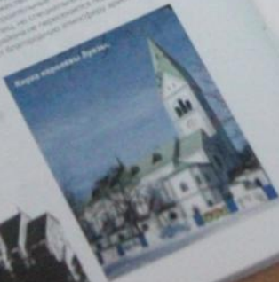
Кирха в районе Кутузова.