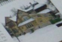
Большой особняк в районе Кутузова.