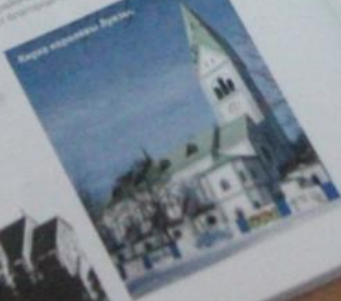
Кирха в районе Кутузова.

Амалиночу был назван в честь героя Отечественной войны 1812 года. Он должен был стать в честь Северного Часта Восточного фронта, который был выделен для военных действий. В начале 1920-х годов в районе Кутузова и проспекта Победы были построены десятки красивых особняков, которые сохранились до наших дней. Это самые интересные из них. Они были построены в стиле неоклассицизма и неоготики. В то время это были самые дорогие и красивые дома в городе. Многие из них принадлежали известным людям, которые жили в них до войны. После войны многие из них были разрушены, но некоторые сохранились. Сейчас это один из самых красивых районов города.