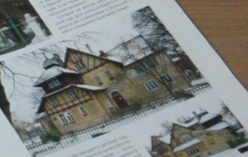
Большой особняк в районе Кутузова.

Образцы уникальной архитектуры Кёнигсберга сохранились в районе Кутузова и проспекта Победы. Это самые интересные из них. Они были построены в стиле неоклассицизма и неоготики. В то время это были самые дорогие и красивые дома в городе. Многие из них принадлежали известным людям, которые жили в них до войны. После войны многие из них были разрушены, но некоторые сохранились. Сейчас это один из самых красивых районов города.