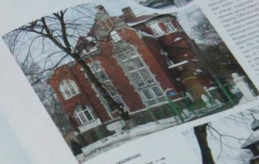
Большой особняк в районе Кутузова.