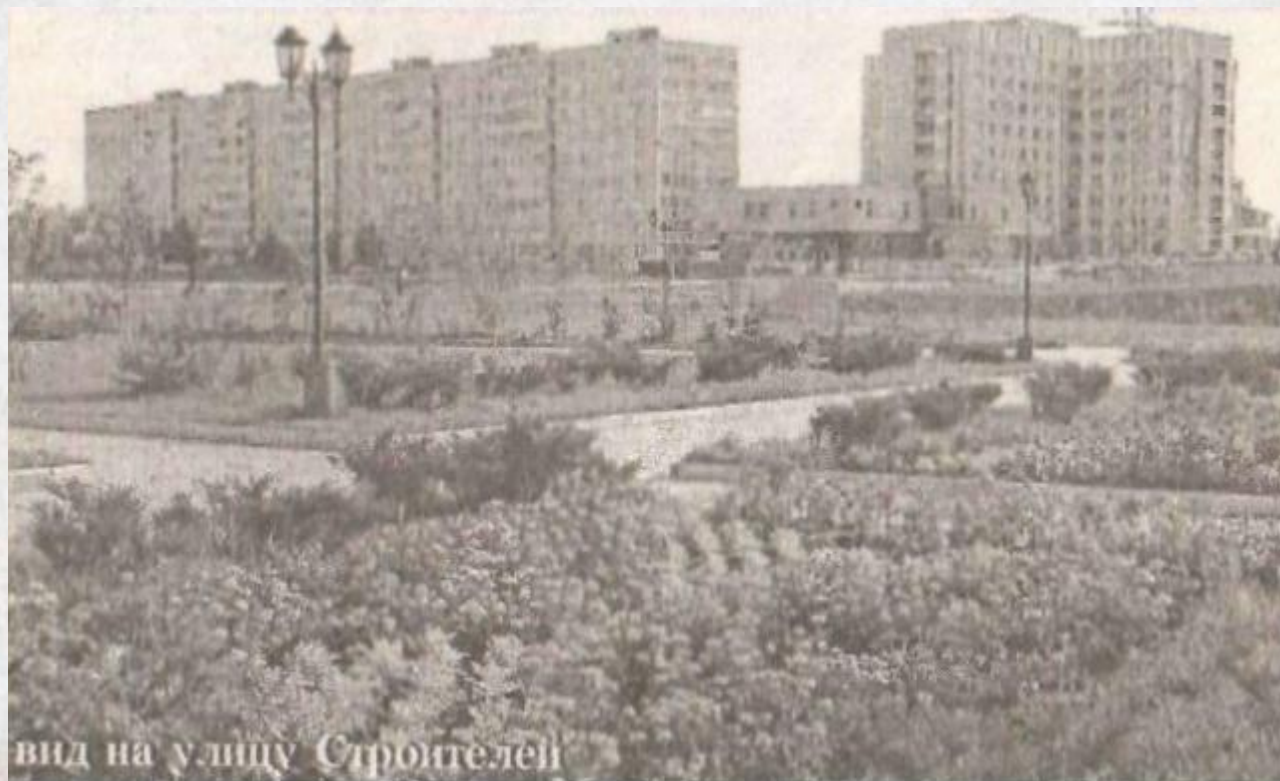
вид на улицу Строителей

В районах новой застройки, как правило, появлялись улицы Строителей. Это одна из первых улиц и нашего города с двухэтажными деревянными сборными жилыми постройками 60-х годов. Одна из строительных бригад прибыла из г. Львова — так и осталась над Саймой улица с одноимённым названием. Со временем появилась и собственно улица Новая, идущая от храма к старому кладбищу.