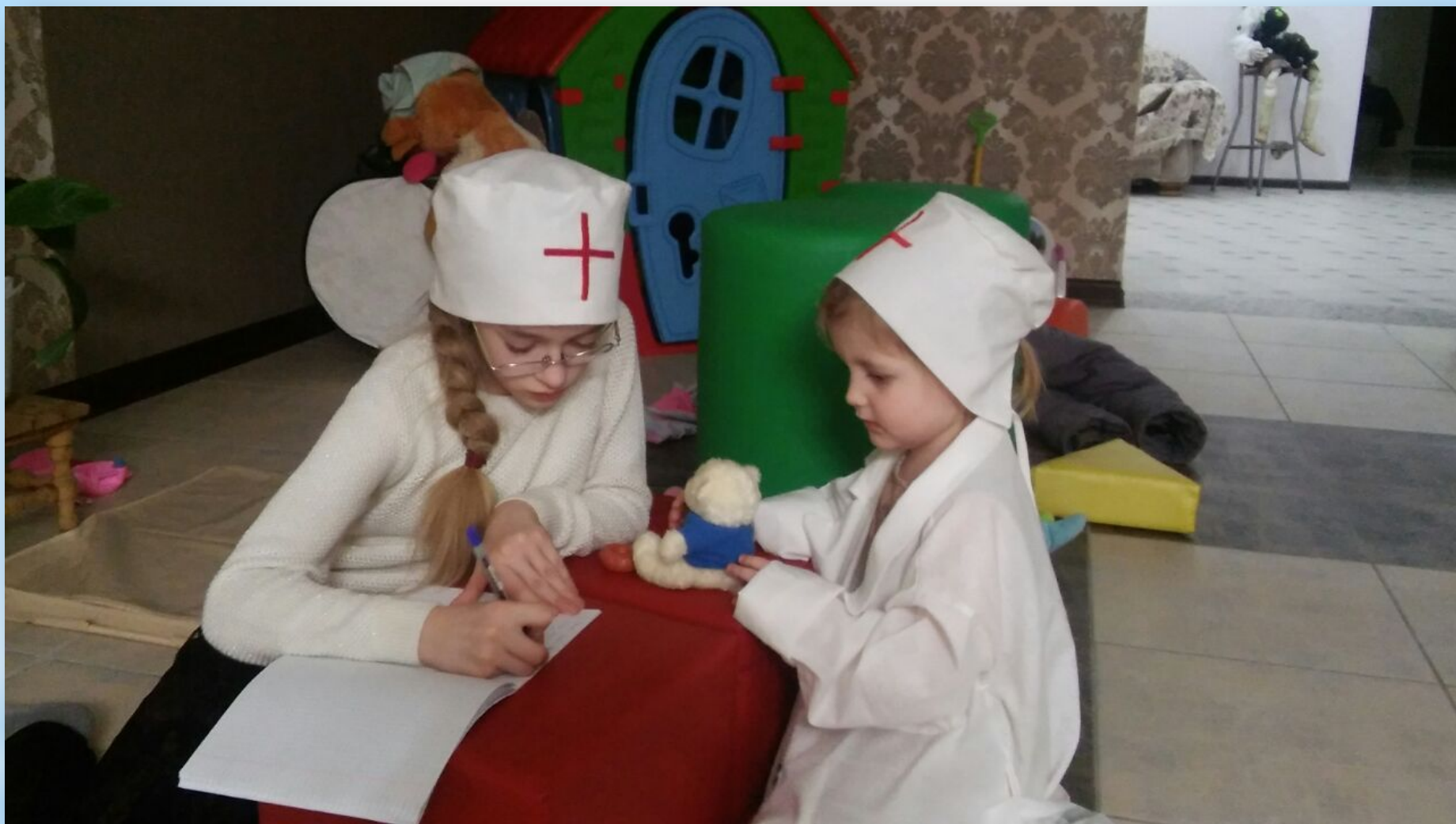
Самостоятельная творческая сюжетно-ролевая игра в домашних условиях