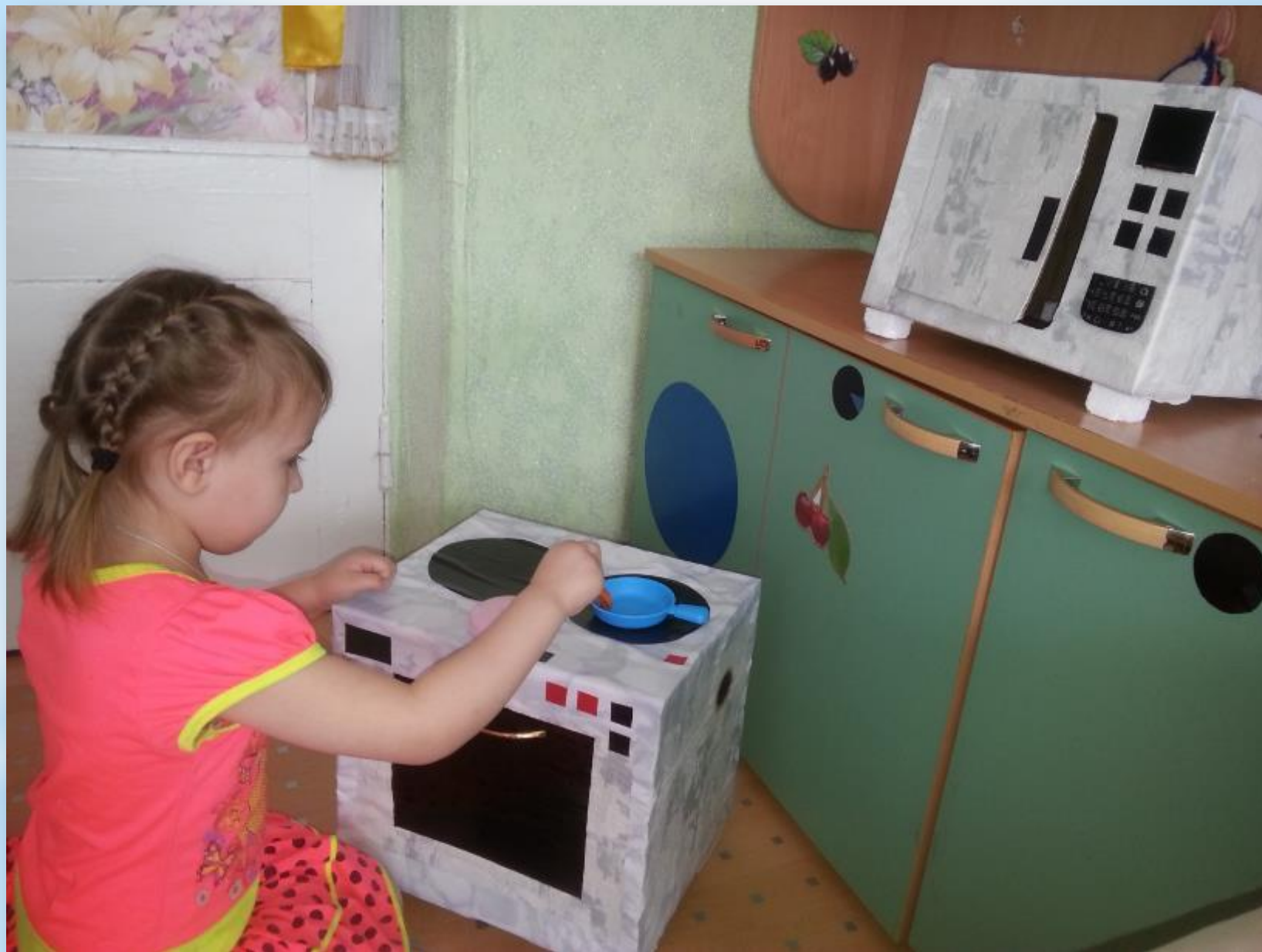
«Готовим обед для гостей»