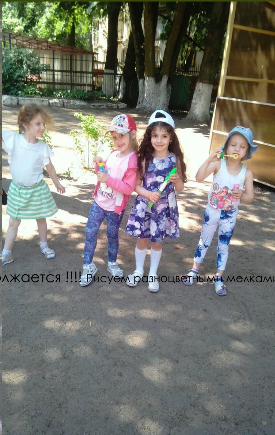
Праздник продолжается !!!! Рисуем разноцветными мелками