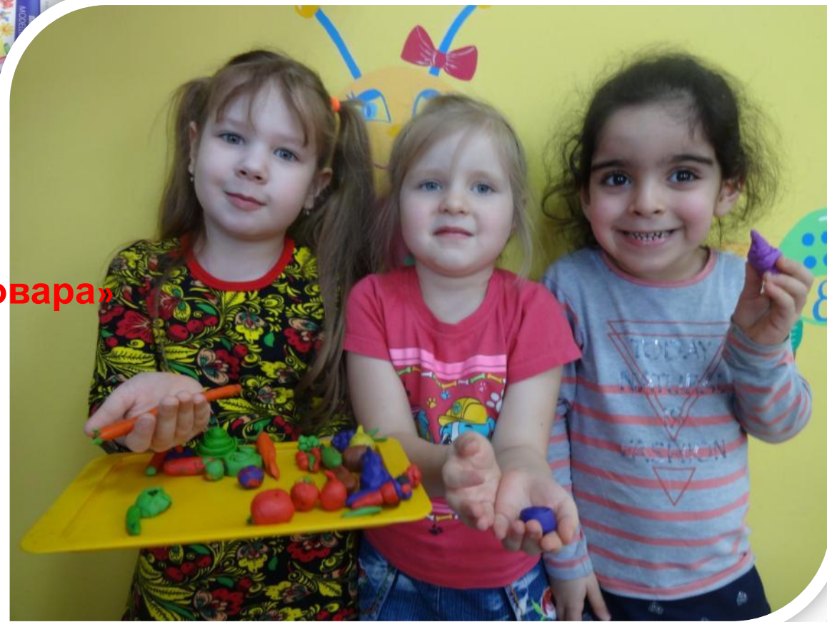
Лепим «Овощи для повара»