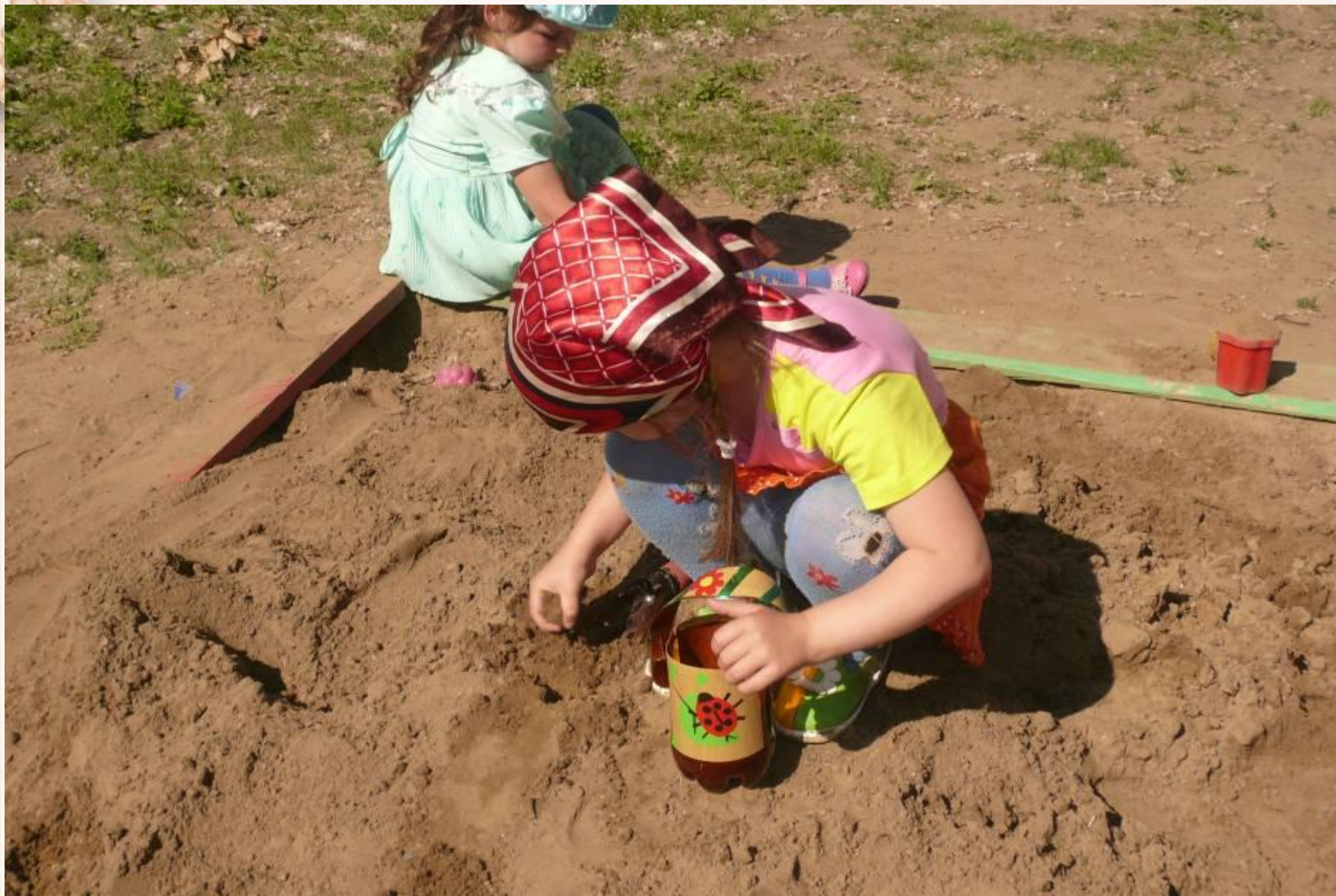
Ведерки для игр с песком