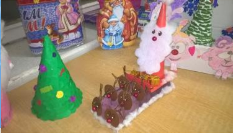
Фото конкур с.