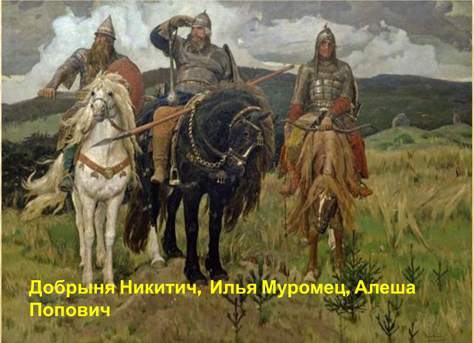
Добрыня Никитич, Илья Муромец, Алеша Попович

ГЛАВНОЕ, ЧТО ОБЪЕДИНЯЕТ ГЛАВНЫХ ГЕРОЕВ, – ТО, ЧТО ЭТИ ЛЮДИ НАДЕЛЕНЫ НЕЧЕЛОВЕЧЕСКИМИ ВОЗМОЖНОСТЯМИ.