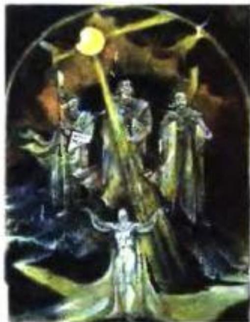
■ Кий, Щек, Хорив и Лыбидь. «Моя Киевская Русь». Художник Ф. Нирод. 1992 г.

Вопрос: «Откуда есть пошла Русская земля и кто в ней начал первый княжить и как Русская земля стала?», впервые поднятый летописцем Нестором, так и не получил в исторической науке однозначного