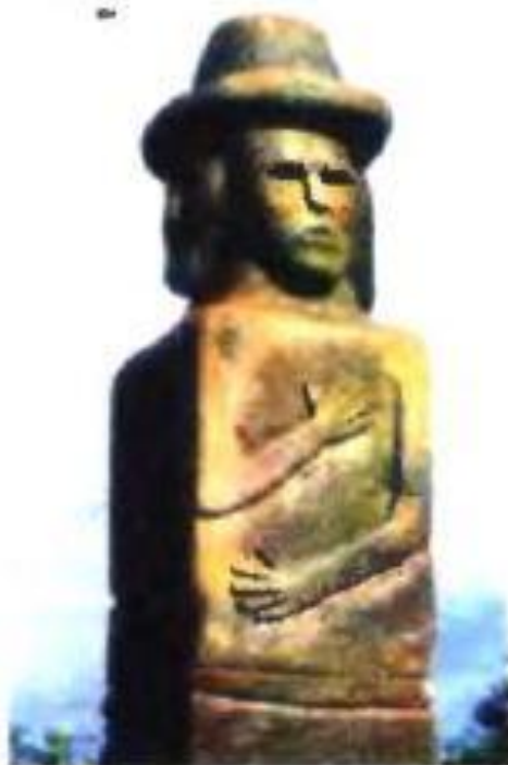
▲ Фрагмент Збручского идола. X в. Реконструкция

Как и в предыдущие века, крестьяне обожествляли явления природы, небесные светила, деревья, реки, придерживались культа рода. Они воспринимали мир триединым: люди, космос, боги. Так, в Збручском идоле (символизирует бога – творца Вселенной Рода ) изображения расположены в трех ярусах: в верхнем – небесные боги, в среднем – люди, в нижнем – подземный мир с богом, держащим в руках землю. Религиозные обряды совершали в святилищах, которые строились из дерева. В них сооружали капище – место, где приносились жертвы богам. Здесь же находились жрецы-волхвы (волхв – мудрый), служители культа, которые помнили и совершали обряды, заговоры, исполняли ритуальные песни, вычисляли календарные сроки магических действий, знали целебные свойства трав. Изображения идолов вырезались из дерева или камня.