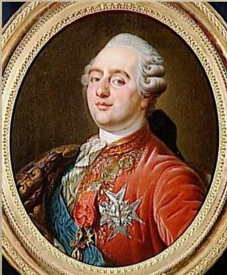
Людовик XVI 1774 - 17913