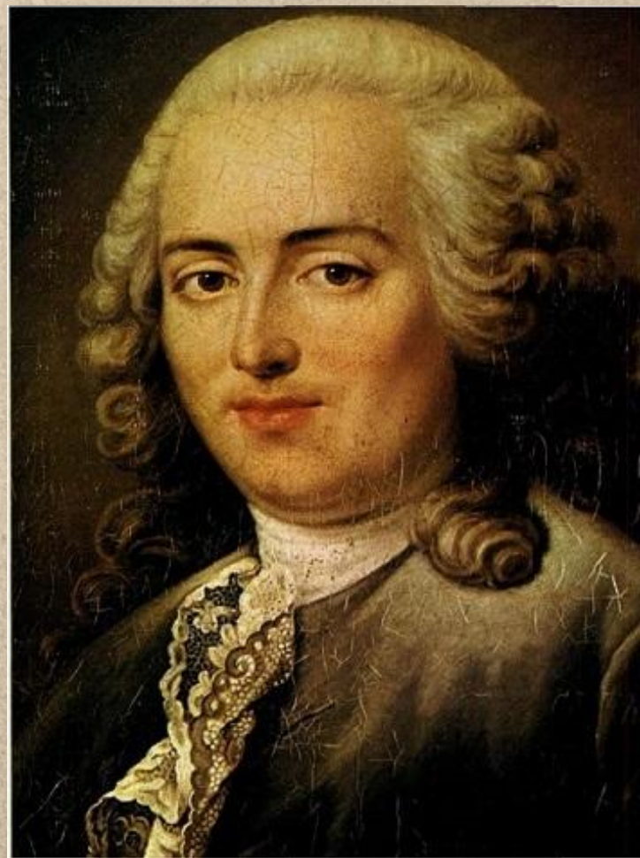
Анн Робер Жак Тюрго 1727 -