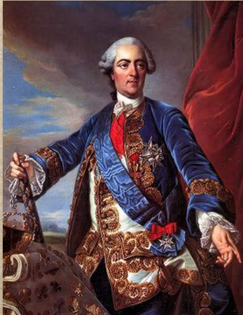
Людовик XV 1715 – 1774