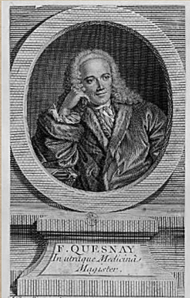
Франсуа Кенэ 1694 - 1774

Физиократия (др. греч. φύσις — природа; κράτος — сила, власть, «власть природы»)