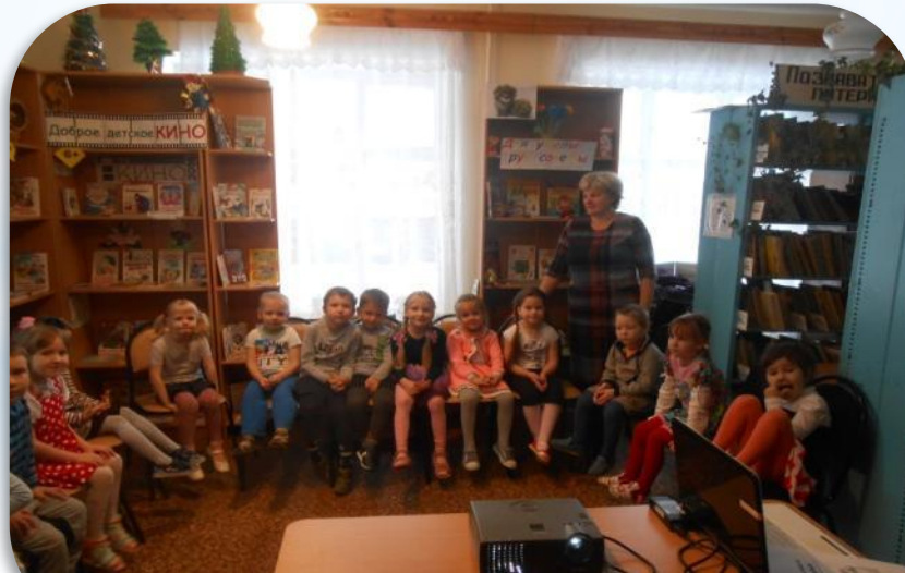
Встречи в библиотеке