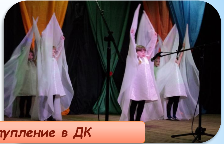
Выступление в ДК