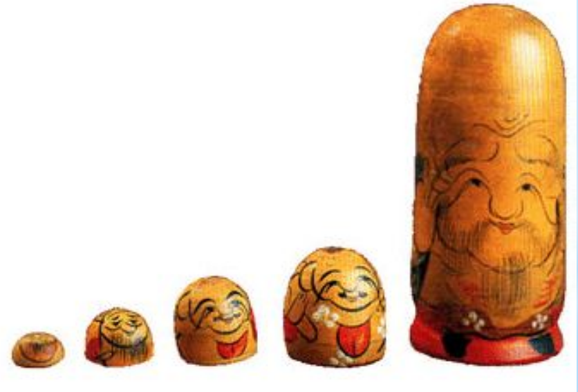
Разъёмные точёные фигурки Фукурума.