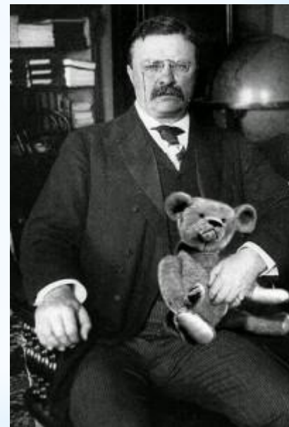
Теодор Рузвельт, президент США, с медвежонком Тедди.