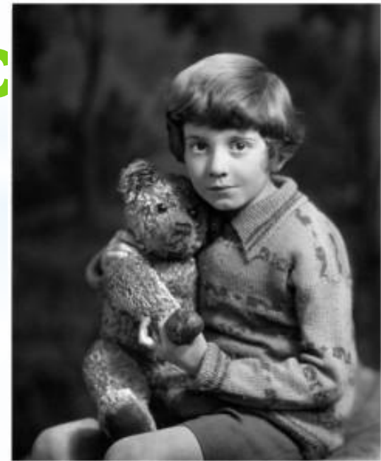
Кристофер Робин с медвежонком Тедди

Изучение истории появления игрушек знакомых нам с детства.