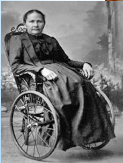
Маргарет Штайф, основательница фирмы «Steiff»