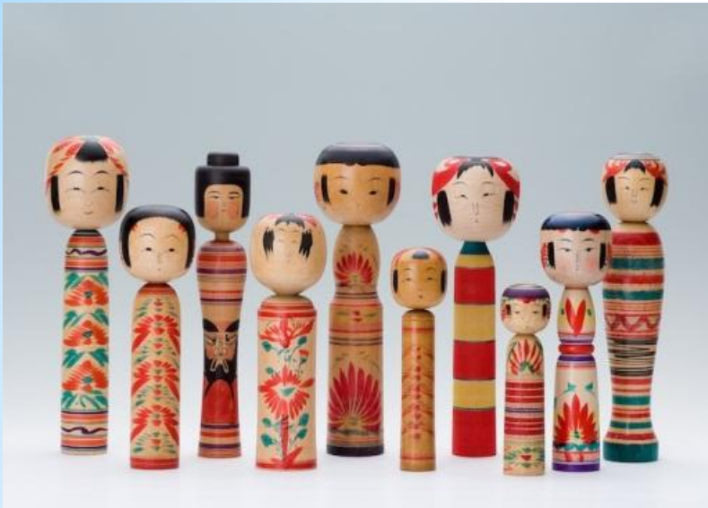
Традиционные, неразъёмные куклы Кокэси

Прообраз русской матрёшки – деревянные игрушки из Японии