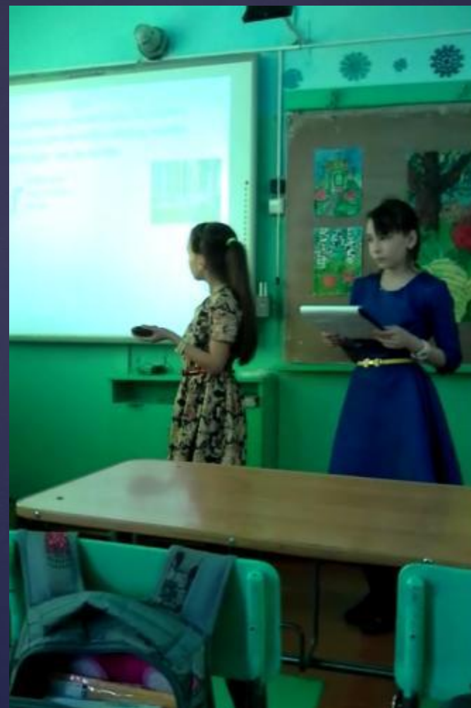
Проект «Моя малая Родина»