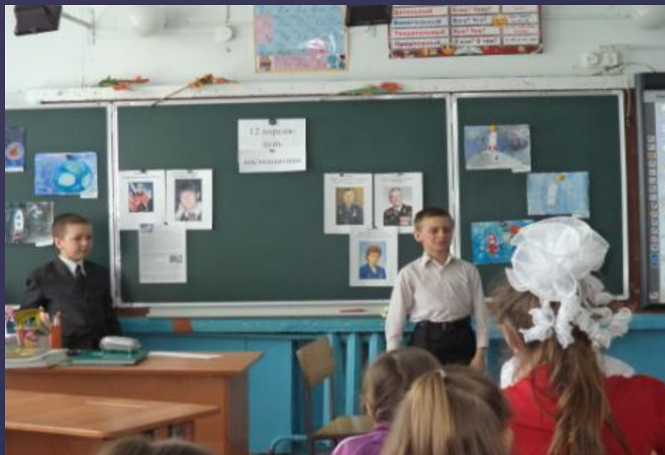
Проект «Загадочный космос»