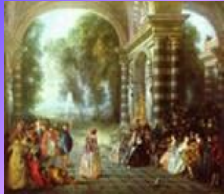
Ватто Антуан - Радости бала.