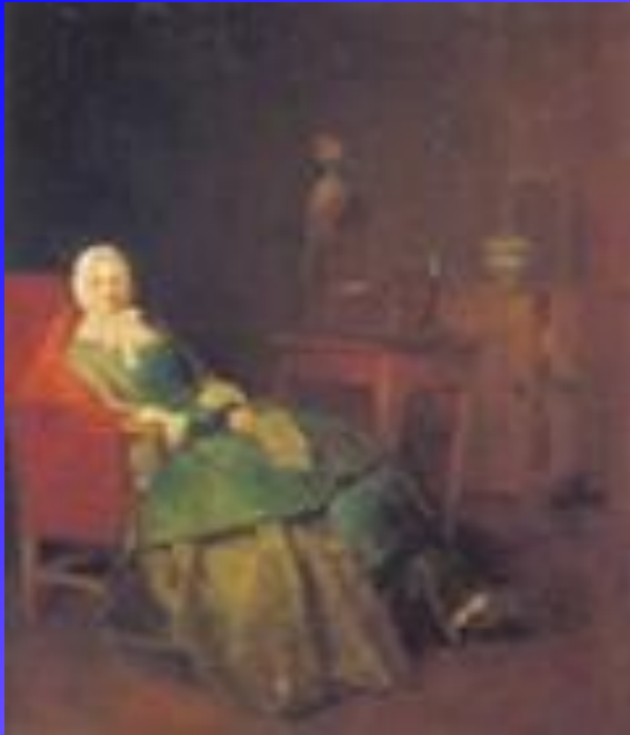
ШАРДЕН, ЖАН-БАТИСТ СИМЕОН Домашние радости.(1699-1779), французский живописец;