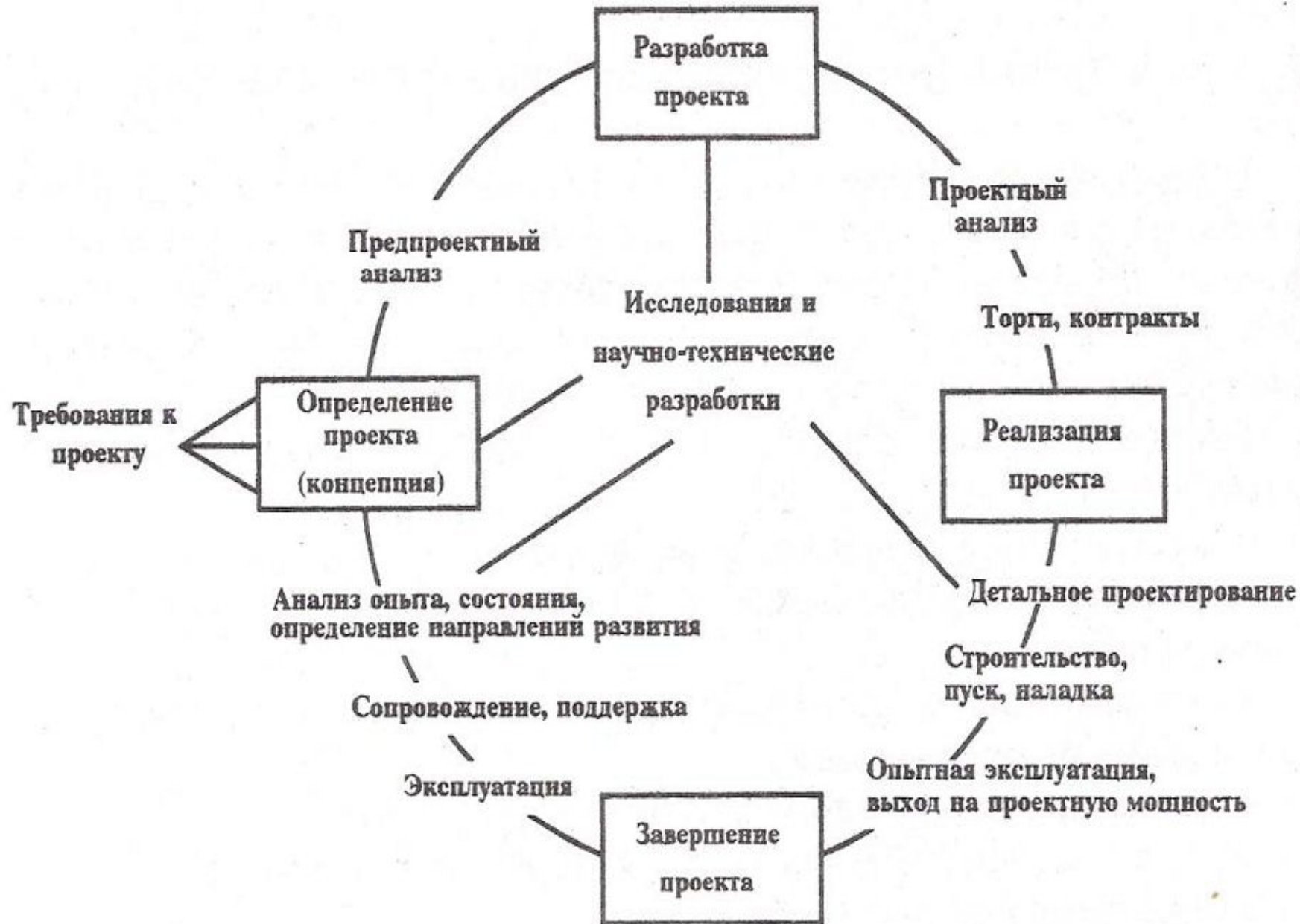
Рис. 12. Схема жизненного цикла проекта.