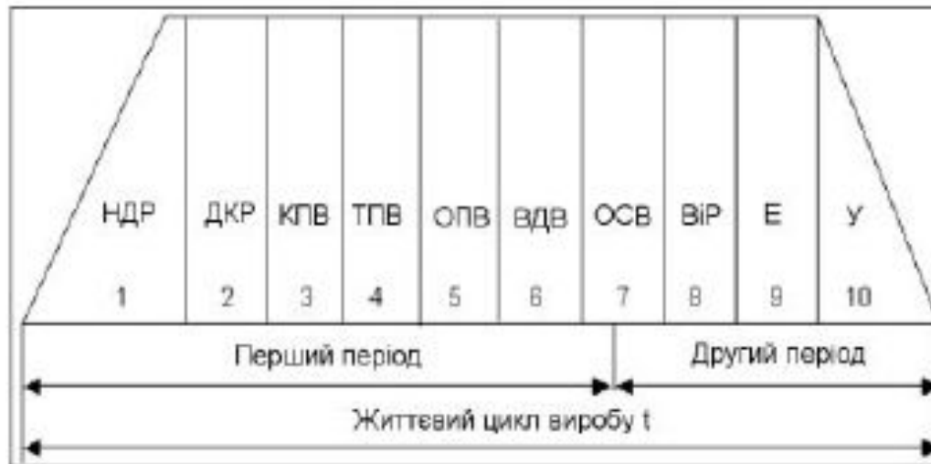
Рис. 1.1. Структура життєвого циклу виробу.

Витрати на виготовлення нового виробу в перший рік його випуску можуть у декілька разів перевищувати витрати наступних років. Це знижує рівень ефективності виробництва нової техніки, а іноді призводить до великих збитків.